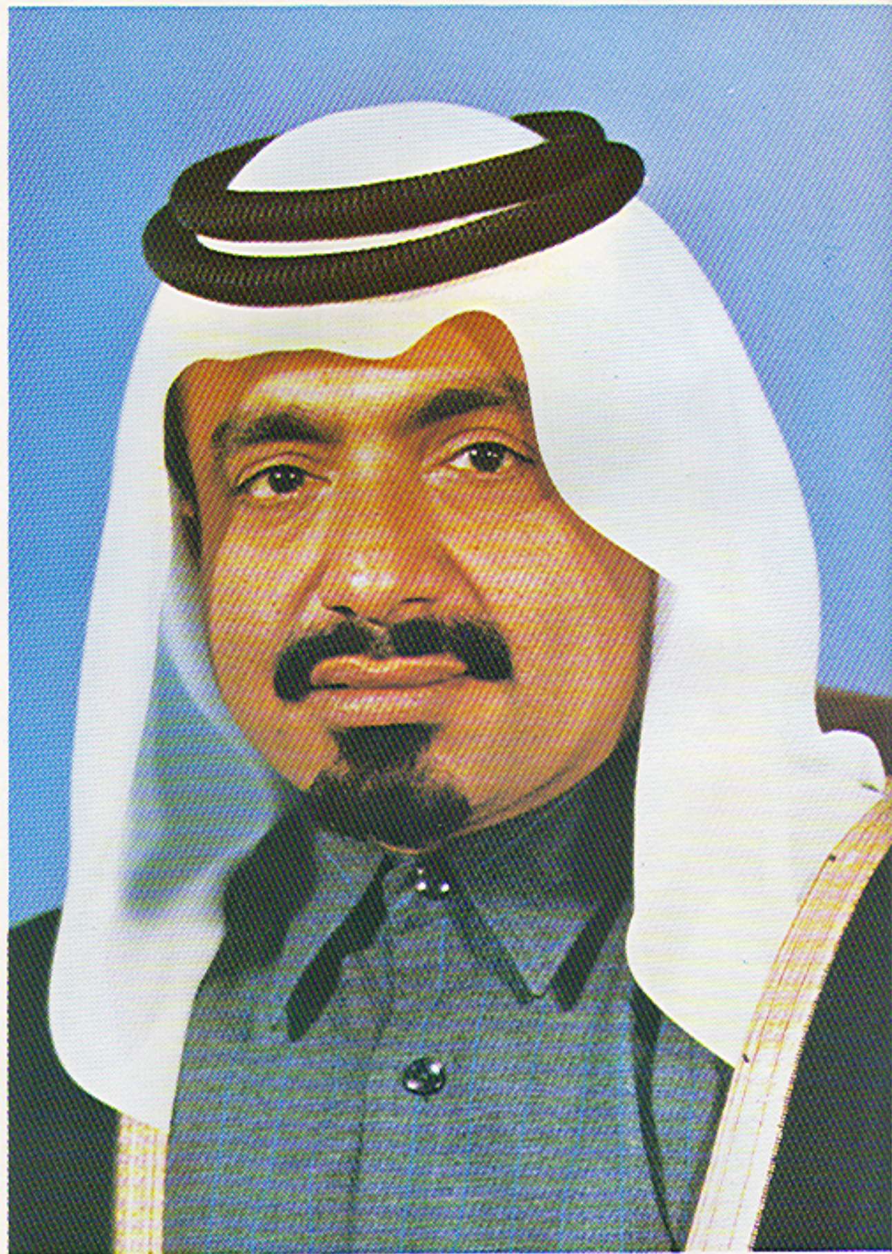
حضرة صاحب السمو الشيخ خليفة بن زايد آل نهيان أمير دولة قطر